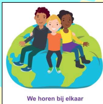
We horen bij elkaar

Blok 6 We zijn allemaal anders (over verschillen en overeenkomsten)